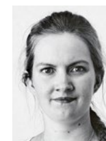
Henna Iire Matemaatikko ETK